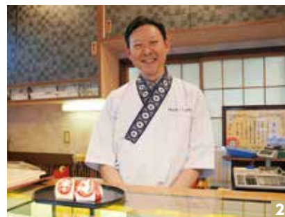
1 TOP INTERVIEW (株)キャロットシステムズ 2 わが社のいち押し (有)菓子工房 くろさわ