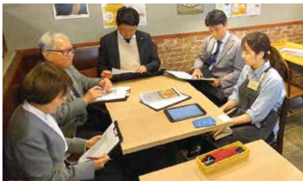
飲食業部門 大賞「ほーむばる ITADAKI」の臨店審査の様子

同賞は、相模原の魅力ある店舗を表彰し、地域商業の活性化と消費者へのサービス向上を目的としている事業です。22回目を迎えた今回は、「もっと知ろう 好きになろう わたしたちのまち」をテーマに投票を呼びかけ、7486票と前年を上回る投票（前年比116%）がありました。