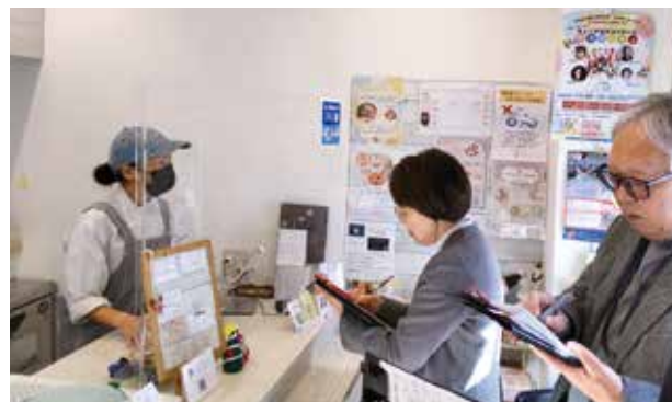
小売・サービス業部門 大賞「おやつところ」の臨店審査の様子