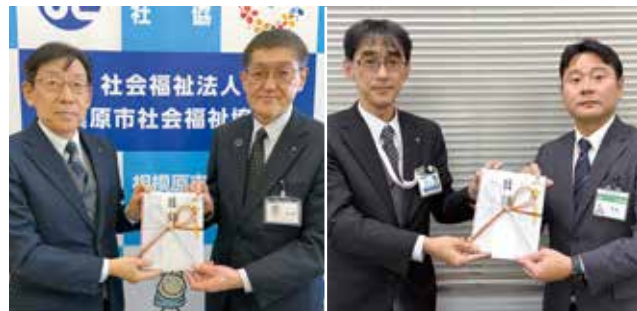
長谷川専務理事(左) 社協 笹野会長(右)