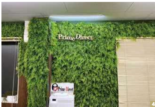
1 事務所入り口から音楽で来客者をお出迎え