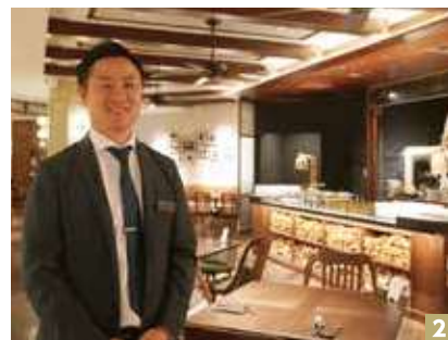
1 TOP INTERVIEW プライムダイレクト(株) 2 わが社のいち押し MONDO 相模大野