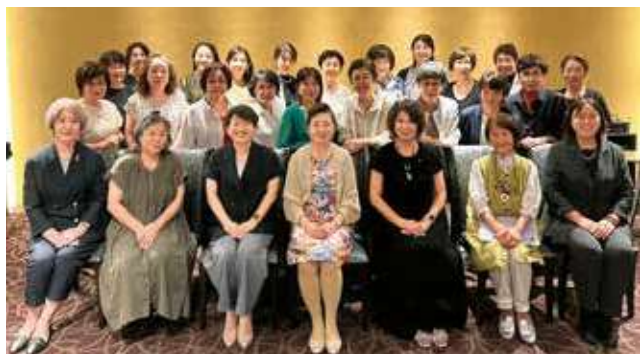
「シルクまちだ」の方々と

女性会は7月16日、中国名菜敦煌（相模原市中央区）にて町田商工会議所女性会「シルクまちだ」との合同で第2回交流会を開催しました。第1部の交流会では、それぞれの女性会の活動報告を行い、活発に意見交換をするなど、お互いにとって良い刺激となりました。第2部の懇親会では、パラグアイの民族楽器「アルパ」の優しい音色を聴きながら、食事に舌鼓を打ち、楽しいひと時を過ごしました。交流会を経て新たなつながりができ、大変有意義な時間となりました。