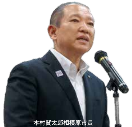
本村賢太郎相模原市長