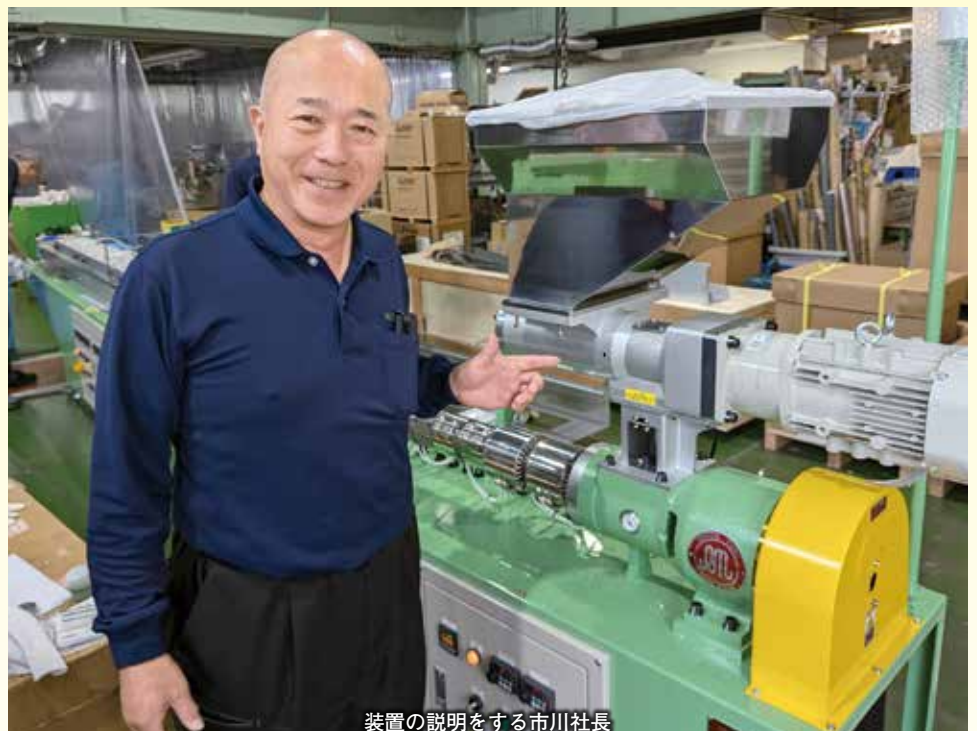
装置の説明をする市川社長