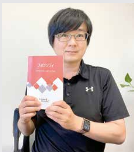
フィロソフィの冊子に手にする福田社長