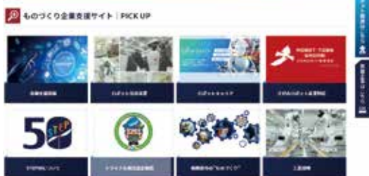
ものづくり企業支援サイト