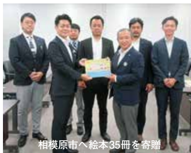
相模原市へ絵本35冊を寄贈

とを目的に制作され、全国各地の図書館などに計1万6千冊以上が寄贈される予定です。