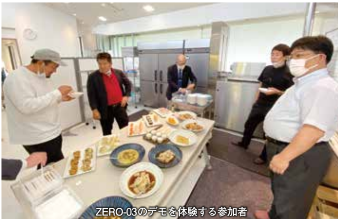
ZERO-03のデモを体験する参加者