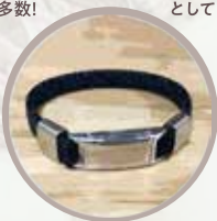
静電気軽減グッズ 冬場の嫌なバチバチを軽減 する機能性ブレスレット。