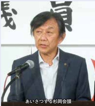
あいさつする杉岡会頭

件を35件上回る、247件と増加しており、商工会議所の支援事業への期待が入会者数に反映されたのではないかと認識しております。