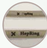
オリジナルプリント ロゴやメッセージの印刷 OK オリジナルグッズの作成に!