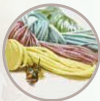
原反 未加工のゴムや紐も、資材 としてご購入いただけます。