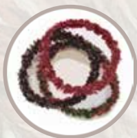
Future Type ふわふわやモコモコなど 不思議なヘアゴム多数!