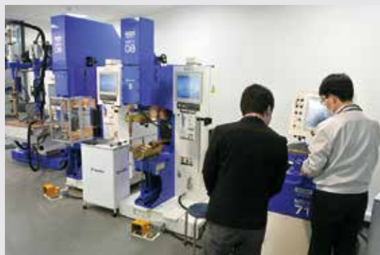
テーブルスポット溶接機の全モデルが展示された