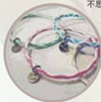
オリジナルチャーム オリジナルチャーム(真鍮製) のお作りも承ります。