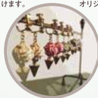
組紐アクセサリ 組紐をピアスやブレスレット への加工もお受け致します!