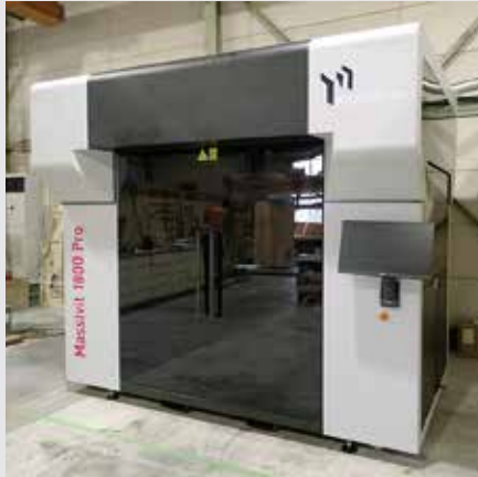
マシビット製3Dプリンター