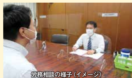
労務相談の様子（イメージ）