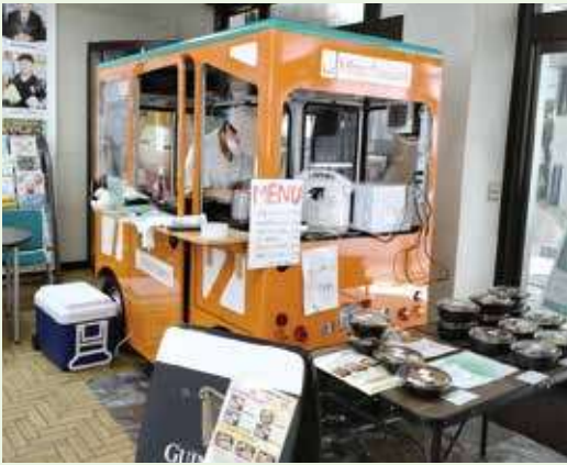
営業する屋内キッチンカー

「そうですね。『あじさいキッチン』と名付け計2台を導入しました。ガソリンを使用しない100%EVですので、建物内の移動ができるだけでなく、商用エレベーターにも乗れます。1回の充電で30キロまで走れ、相模原市内やその周辺地域への出張が可能です。小型EVといっても当社仕様になっていますので、