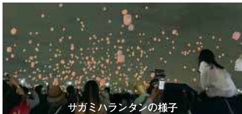
サガミハランタンの様子

また、初日の夜に実施した「サガミハランタン」企画では、上空に無数のランタンが舞い、幻想的な光景が広がった会場内には歓声が沸き上がりました。