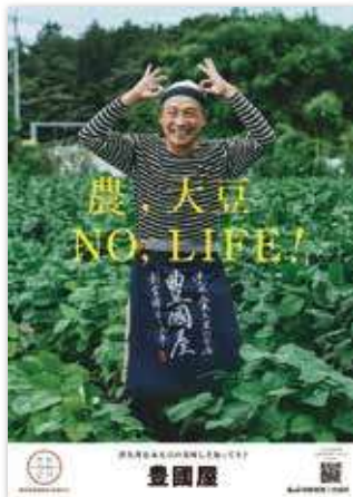
▶今年度制作したポスター（一例）