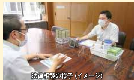
法律相談の様子（イメージ）