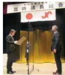
総会にて感謝状が授与された

11月1日、臨時議員総会にて、第17期の任期満了に伴い退任した役員・議員のうち18名に対し、日本商工会議所会頭および相模原商工会議所から感謝状が授与されました。