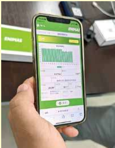
スマホでも確認可能

とはいえ、自社の電力使用量やCO 2 排出量を把握し、脱炭素化を図ろうとしても「どこから着手してよいか分からない」という中小企業も少なくないはず