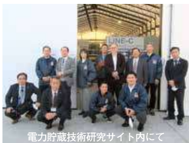
電力貯蔵技術研究サイト内にて

参加者からは「脱炭素に向けた取り組みにおいて、水素エネルギー社会を目指す本事業は大変参考になった」との感想が寄せられ、次回の提言書作成に向けて有意義な機会となりました。