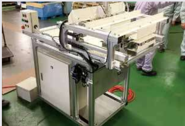
生産性向上も実現

旧本社工場は取引先の製造拠点内に間借りしていたため、念願の自社工場になったという。新工場は2階建てで、総床面積200平方メートル。工業団地内の空き工