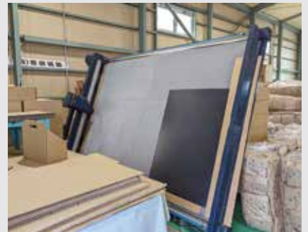
同社の製造現場の様子

段ボール製造、東鈴紙器（中央区小町通）は、個人向けにオーダーメイド段ボール箱の製作事業を開始した。フリーマーケットアプリやインターネットオークションの普及などで、個人間での売買が増えてきたため、規格品にはないサイズ・形状の段ボール箱に対する需要拡大を見込んだ。1箱単