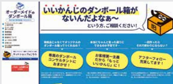
開設した専用サイト