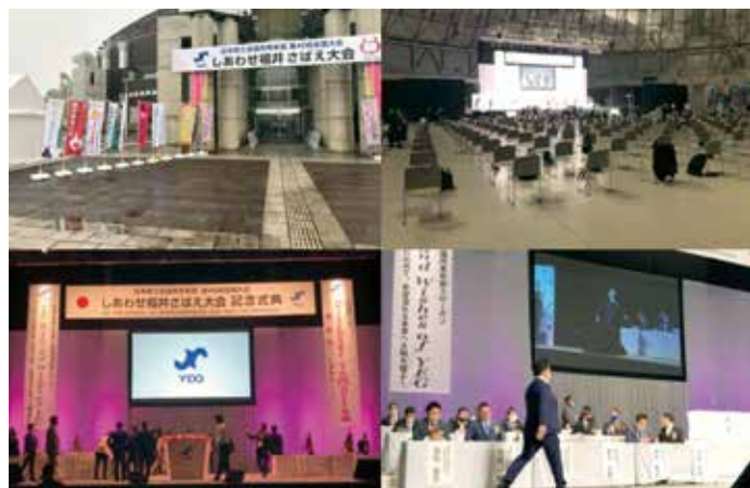
現地会場の様子

当所青年部からは16名が参加。福井県の産業振興施設「サンドーム福井」から配信された会員総会や記念