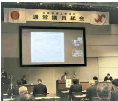
令和3年度の事業計画（案）・収支予算（案）などを審議

当所は3月26日、相模原市立産業会館で「第96回通常議員総会」を開催しました。新型コロナウイルス感染症防止のため、会場出席とオンライン出席が可能なハイブリッド方式で実施。当日はオンライン18名、会場34名（委任状出席68名）、合計120名の議員が出席し、令和3年度事業計画（案）並びに一般会計および各特別会計（3会計）の収支予算（案）等について審議し、いずれも原案どおりに承認されました。