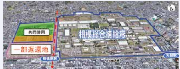
【相模総合補給廠と一部返還地】

相模原市では、相模原駅北口地区(相模総合補給廠一部返還地)のまちづくりを進めています。現在、一部返還地に導入する機能について検討を進めています。この検討の参考とするため、市民等の皆様が対象に、まちづくりに関するWEBアンケートを実施します。4月15日号の「広報さがみはら」や市内公共施設等に掲示するポスターに、回答用QRコードを掲載するほか、市ホームページからも回答可能です。皆様のご応募をお待ちしています。(回答期間... 4月15日(30日))