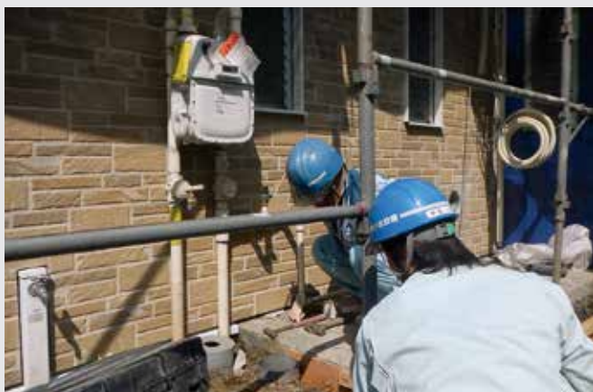
社長としてやれるスキルを身に付ける