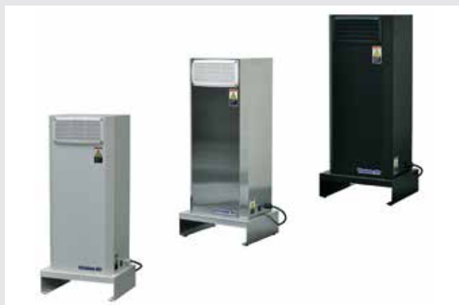
小規模店でも導入しやすくした