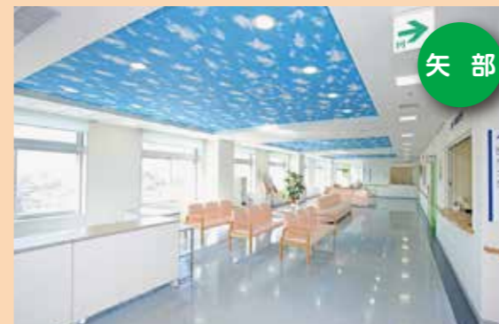
JCHO(ジェイコー)相模野病院