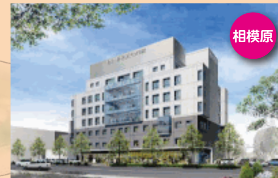
総合相模更生病院