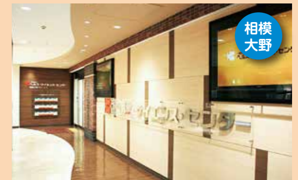
ヘルス・サイエンス・センター