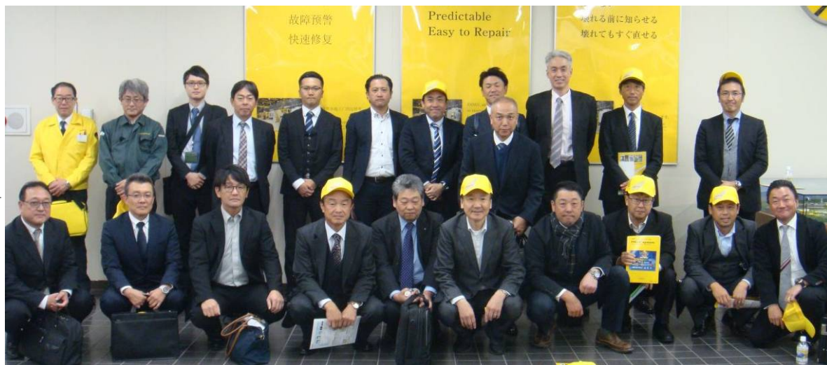
参加した工業部会メンバーや関係者

同社は、工作機械用CNC装置や産業用ロボットなどを中心に、工場の自動化設備の開発・製造を行っている。産業用ロボット分野では、世界4大メーカーの一つにも数えられ、世界中の製造現場における自動化を大きく牽引している。今回、視察した本社工場は、53万坪もの敷地内に数多くの工場が点在する工場群で、それぞれが高度に自動化された最先端の生産設備である。当日は、まず中央テクニカルセンターにおいて、CNCやサーボモーター、ロボマシンといった同社製品の展示コーナーを視察した。担当者によれば、「FA」「ロボット」「ロボマシン」という従来からの3本柱に加えて、近年は「FIELD systems」と呼ばれるAI(人工知能)、IoT(モノ