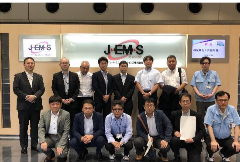
参加したメンバーと会社

開始した新会社。年間約数百万台の携帯情報端末や各種の表示端末装置などを手掛けている。同社工場の生産ラインは自動化率70%を誇り、省力化のモデル工場として注目を集めている。一行はプリント基板の実装工程から多品種に対応したフレキシブル生産