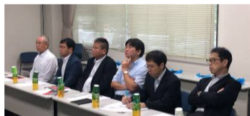
熱心に聞き入る参加者たち

ラインを見学。その後、作業バラツキやポカミスといったヒューマンエラー防止のために、組み立て工程などを自動化したラインにも触れた。このラインでは、自社開発による自動機や治具・試験機を導入しており、品質の安定化を実現させている。参加者たちは自社の経営にも反映させようと、熱心に見入っていた。