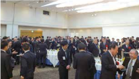
昨年度は過去最高の500名超が参加