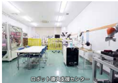
ロボット導入支援センター

ロボット活用に積極的に取り組むレジャー施設「プレジャーフォレスト」の全面協力により、市内企業等のサービスロボット実証やドローンフィールドさがみ湖でのドローン飛行の様子などを体感頂けるバスツアー。(12月4日(火) / 定員30名)