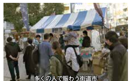
多くの人で賑わう街道市

同社の稲吉代表取締役は「晴天に恵まれ、お客様の反応もよく好評だった。来年も伴走型支援が受けられれば出展したい」と感想を述べていました。