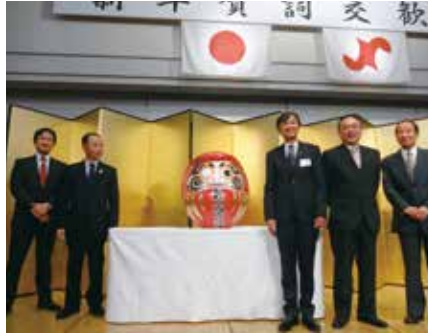
昨年度のだるまの目入れの様子