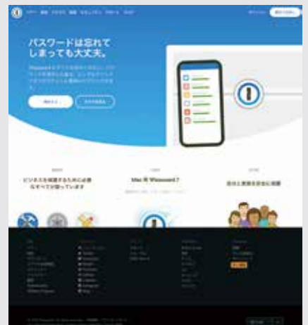
最も安全なパスワードマネージャー！1Password https://1password.com/jp/

さらに、パスワードを使い回していたり二段階認証が提供されているサービスで有効にしていなかった場合に警告がでるようになりました。WindowsやMac、スマートフォンでは顔認証や指紋認証でアプリを起動できるのも大変快適です。30日間の試用も可能なのでぜひ試してみてくださいはいかがでしょうか。