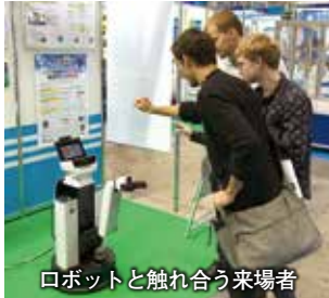
ロボットと触れ合う来場者

の活躍が期待されるさまざまな分野で、世界中から集結したチームがロボットの技術やアイデアを競う