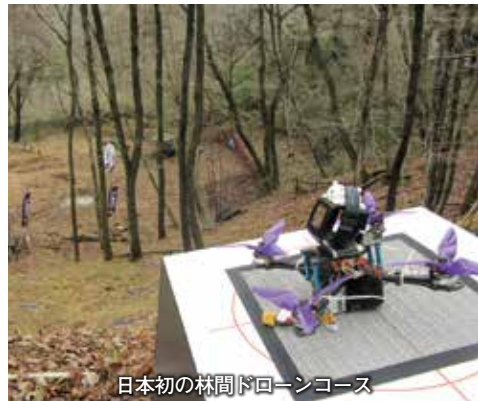
日本初の林間ドローンコース