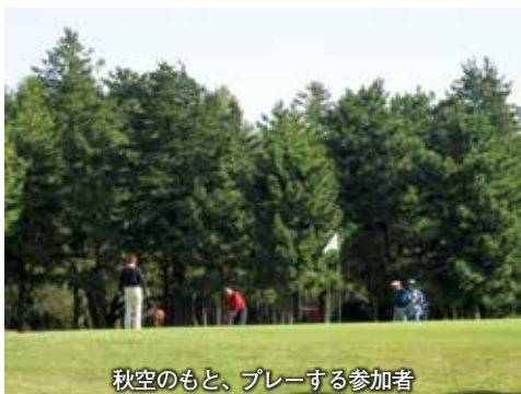
秋空のもと、プレーする参加者

公益社団法人相模原法入会と当商工会議所の共催による「会員親睦チャリティーゴルフ大会」が10月22日、相模原ゴルフクラブ（中央区大野台）で開催されました。 当日は会員ら245名が参加。参加者は晴天の秋空のもと、名門ゴルフコースでプレー