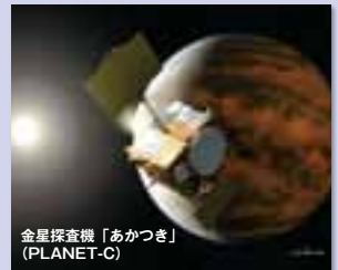
金星探査機「あかつき」 (PLANET-C)

星探査機「のぞみ」に続く日本による惑星探査計画で、金星の大気の謎を解明することが目的です。「地球の兄弟星」と言われている金星の大気の謎を解明することで、地球が穏やかな生命あふれる星となった理由や気候変動を解明する大きな手がかりが得られます。そのため、「あかつき」による金星探査は、地球環境を理解する上で最も重要な探査対象といえます。