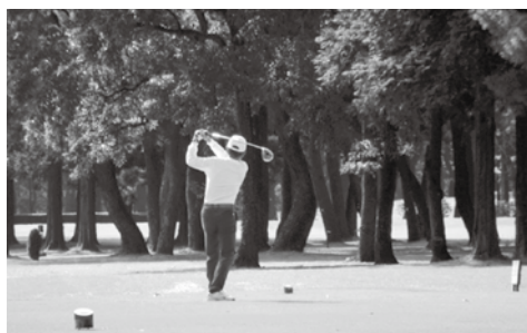
秋空のもとでプレー

協賛企業 各社よりご提供いただいた協賛品等は、コンペ入賞者に大変ご好評いただき、おしくも入賞を逃した参加者は次回大会に向けて意気込みを新たにしました。 なお、参加者から集まったチャリティー金112,070円は、相模原市の「頑張れ大船渡銀河連邦応援金」や今年4月の熊本地震被災地の支援、市内福祉振興等に寄付し役立てていただきます。