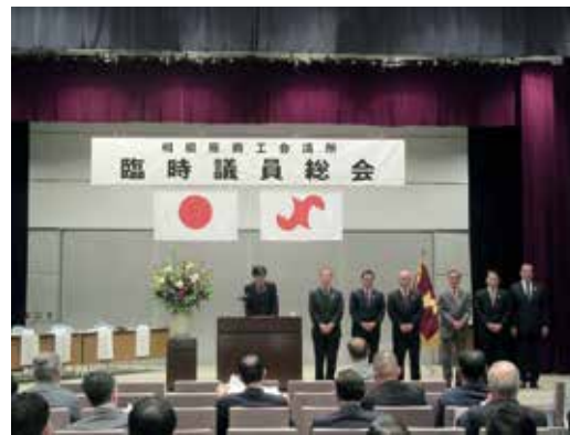
杉岡会頭が所信表明