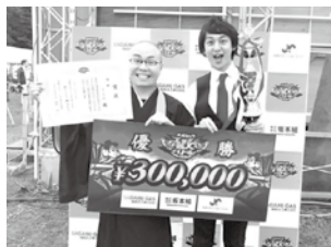
第1回の王者「ドドン」さん