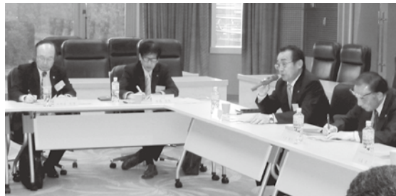
意見交換会の様子