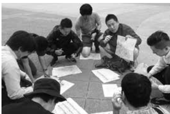
競技の戦略を立てる会員

競技終了後には、勝利・敗北の要因やどうすればもっとチームが機能したのかなどを全員で議論をし、今後の会社経営に活かせる学びを得ることの出来た例会となりました。