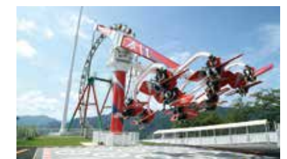
絶叫アトラクション「極楽パイロット」

ド』、食材・機材の準備から片付け、火熾しなどがすべてセットになった『手ぶらBBQプレミアム』といったプランを用意しています」