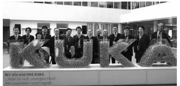
ドイツ視察「KUKA本社にて」

リーオートのメーションの会社で1973年から溶接ロボットの生産を開始し、自動車産業を中心に全世界に広まっています。現在同社では、研