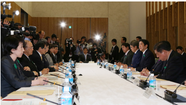
あいさつする安倍首相（右から 2 人目）と三村会頭（左から 2 人目）