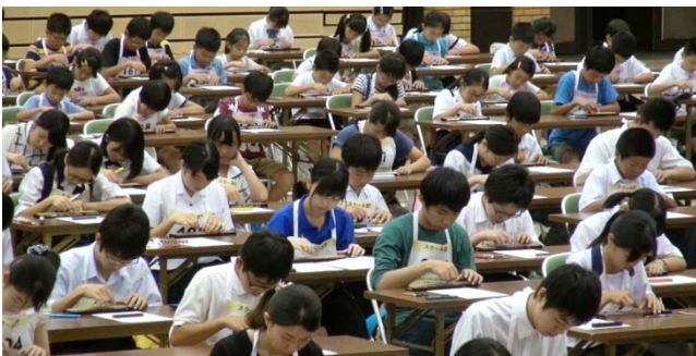
参加者の熱気に包まれた会場

日本商工会議所と日本珠算連盟は8月2日、兵庫県神戸市で「そろばんグランプリジャパン2015」を開催。全国各地から305人が参加し、小学生以下のジュニア部門（133人）、中学・高校生のスクール部門（111人）、シニア部門（61人）の3部門に分かれ、日頃の練習の成果を競い合った。