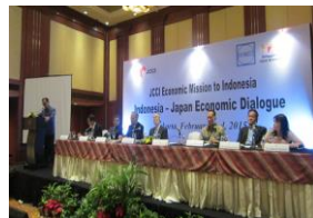
インドネシア商工会議所等と意見交換

2日は、インドネシア商工会議所とインドネシア経営者協会と意見交換があり、中小企業の協力関係構築について議論したほか、3日には、ミンASEAN事務総長と懇談した。