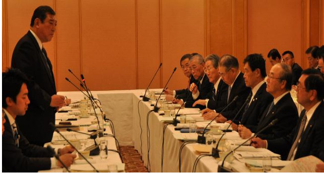
地方創生に意欲を示す石破大臣(左から2人目)と 意見交換する三村会頭(右から2人目)

日本商工会議所は1月15日、都内のホテルで石破茂地方創生担当大臣との懇談会を開催した。懇談会には、日商から、三村会頭はじめ、副会頭など14人が出席。内閣府から石破大臣はじめ、平将明副大臣、小泉進次郎大臣政務官、伊藤達也大臣補佐官など幹部9人が出席し、意見交換を行った。