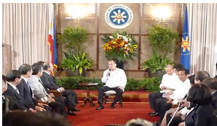
アキノ大統領を表敬訪問した三村会頭(左から4人目)

5日には、フィリピン商工会議所、比日経済委員会と意見交換会を開催し、約100人の現地企業が参加。日本企業との交流に対する高い期待が感じられた。