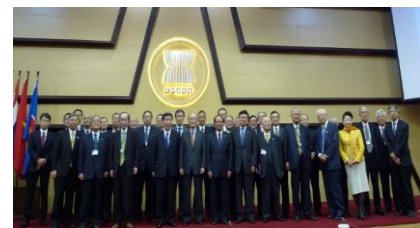
ミンASEAN事務総長と懇談