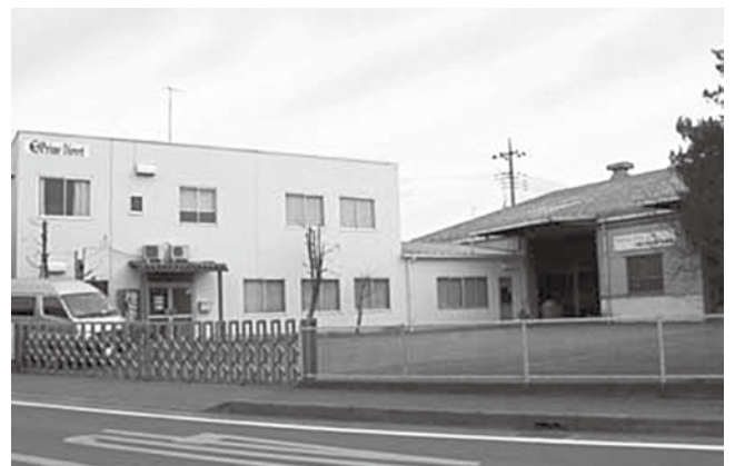
リサイクルトナーを生産する同社の工場

一方、トナーは同社で製造販売するリサイクルトナーを採用している。同分野において世界で唯一の品質基準を定めた「ST