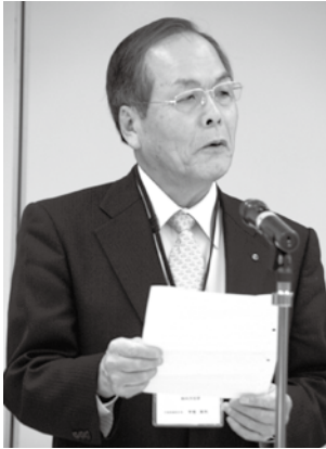
あいさつする甲斐部会長

甲斐部会長は「さまざまな分野の企業が一堂に介した。交流を通じて、経営のヒントもつかんでいただきた」とあいさつした。