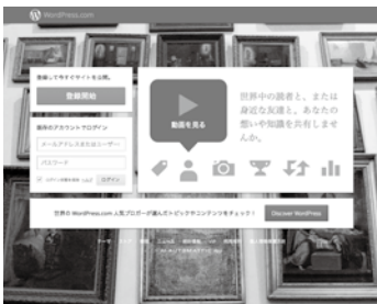
【図版】 wordpress.com.png 無料でWordPressのブログ が作れる「WordPress.com」 http://ja.wordpress.com/