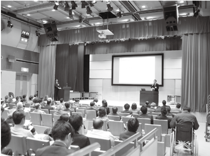
産業会館で行われた説明会の様子