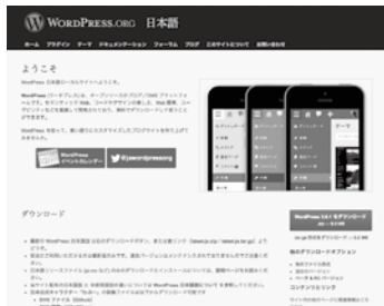
【図版】 wordpress.org.png サーバーインストール型 WordPressのサイト 「WordPress.org」 http://ja.wordpress.org/

WordPressをサーバーにインストールして利用する場合はレンタルサーバーや独自ドメインの契約が必要ですが、ブログとしての使い勝手を試してみたいという場合は、メールアドレスの登録だけで使えるWordPress.comというサービスがあります。まずこちらで使い勝手を確認してみるのも良いでしょう。