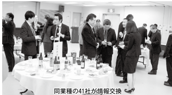
同業種の41社が情報交換