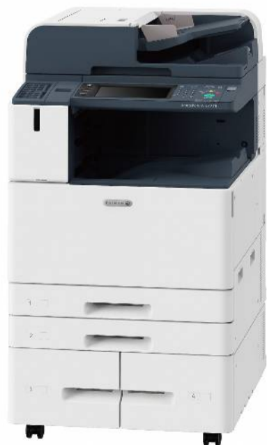
写真は ApeosPort-VI C7771 です。