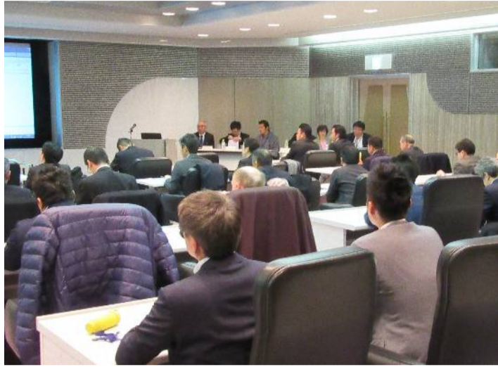
海外進出の話題に聞き入る参加者たち

仕事も趣味も交流から。工業部会会員に垣根を超えた交流を持ってもらおうと、「会員交流大会」が2月21日、相模原市立産業会館で開催された。過去最多の59人が参加。部会活動の経験がない人やビジネスチャンスを広げたい人、趣味の仲間作りをしたい人などが交流を深めた。K I Z U N Aプロジェクト主催。