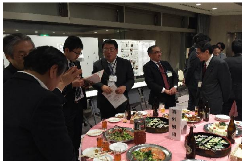
交流シートをもとに話が弾む参加者たち

技術のPRや仕事の依頼、経営に関すること、連携・協力といったビジネスに関する話題のほか、地域情報や趣味・娯楽などの項目も設けられた。それぞれのテーマで