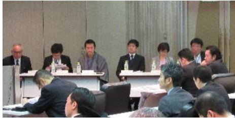
前半に行われたミニセミナー