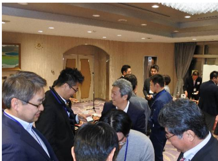
会場で交流を深める部会員たち