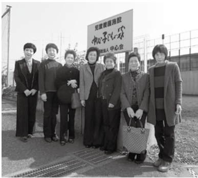
中心子どもの家施設前で

る親子の関わり合いの重要性についてお話をうかがいました。参加した会員らは、今後の社会のあり方や、当会として次世代のこどもたちに何ができるかを改めて考えさせられる貴重な体験の一日となりました。