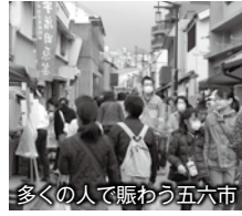
多くの人で賑わう五六市

ここでは、東海道56番目の宿場町の手作り市として有名で、まだ店舗を持ってず発信場所を探している人が、アピールできる場所として活用されており、新たな人たちが商売を始