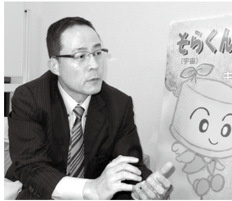
岩手県出身。NPO法人Reライフスタイル副理事長。54歳。

「今年で10年になります。それまで飲料業界で仕事をしていましたが、キャップだけを集めて処理すれば再資源化もできるし、その対価で世界の子どもたちにワクチンを贈るのではないかと考えたのです。しかもこれならだれでも、いつでも、どこでもできると思ったのです。収集活動を行うために協力企業を募り、回収拠点になってもりました。賛同の輪は今、全国に広がっています。この活動を始めたのと同じ