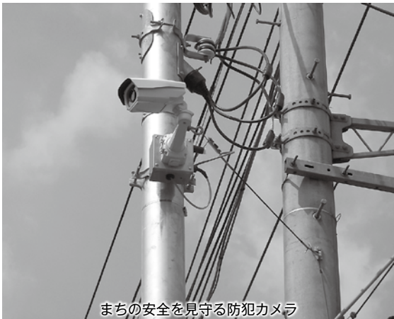
まちの安全を見守る防犯カメラ

相模原市緑区西橋本1-16-18 ☎ 042-775-7200 URL http://www.carrotsys.co.jp