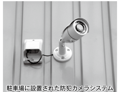
駐車場に設置された防犯カメラシステム

システムは業務用屋外防水型カメラ（4台）+レコーダー（1台）+モニター（17インチ）のセット。カメラは一般的なナログ式映像カメラと最新型フルハイビジョンカメラの2種類を用意しています。ともに夜間撮影も得意な機種で、レコーダー