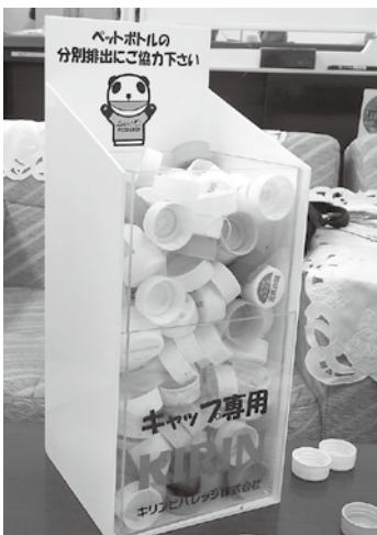
キャップの分別回収を呼びかけるボックス

「環境対応は大企業だけでなく中小企業にとっても大事な社会貢献であり、それを実行することが実は経営にも役立つのです。メタボな経費を減らし、削減した分を環境対応にまわすという発想こそ今の企業に求められている経営姿勢であり、持続可能な社会の形成につながると 생각합니다。これからは障がい者の雇用や、障がい者子どもが安心して生活できるシステムの構築も課題になります。当社は、町田市役所のレストランとカフェで障がいを持つ人が働く企