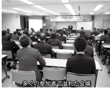
多くの参加者で溢れた会場

この講演会は、工業部会新成長ビジネスGETプロジェクトで主催している「水素社会連続講座」の第3回目として、当研究会と共催により実施しました。講師として、水素研究の第一人者である